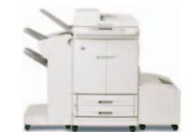
HP Color LaserJet 9500mfp se sešivačkou/odkládacím zásobníkem a volitelným velkokapacitním vstupním zásobníkem