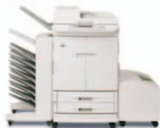
HP Color LaserJet 9500mfp s třídíčkou s 8 přihrádkami

Napájecí kabel, telefonní kabel (pouze v zemích, ve kterých je zajištěna podpora faxu), dokumentace k tiskárně, software tiskárny na disku CD-ROM, přelepka ovládacího panelu, tiskové kazety (4), dva vstupní zásobníky na 500 listů, víceúčelový zásobník na 100 listů, velkokapacitní vstupní zásobník na 2 000 listů (Q1891A), automatický oboustranný tisk, automatický podavač dokumentů, tiskový server HP Jetdirect 620n Fast Ethernet, pevný disk 20 GB EIO – nezbytné zařízení k výstupu papíru je třeba vybrat a objednat samostatně.