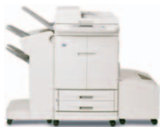
HP Color LaserJet 9500mfp s odkládacím zásobníkem

Q5693A – Třídíčka s 8 zásobníky Každý zásobník třídíčky může být ke snadnému odebrání dokumentů vyhrazen pro jednotlivce, pracovní skupiny nebo oddělení. Třídíčka může být také konfigurována jako třídíčka/odkládací zásobník, odkládací zásobník a separátor úloh.