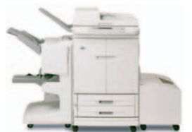
HP Color LaserJet 9500mfp s multifunkčním finišerem a volitelným velkokapacitním vstupním zásobníkem