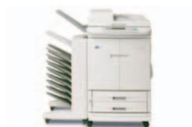
HP Color LaserJet 9500mfp včetně třídíčky s 8 přihrádkami